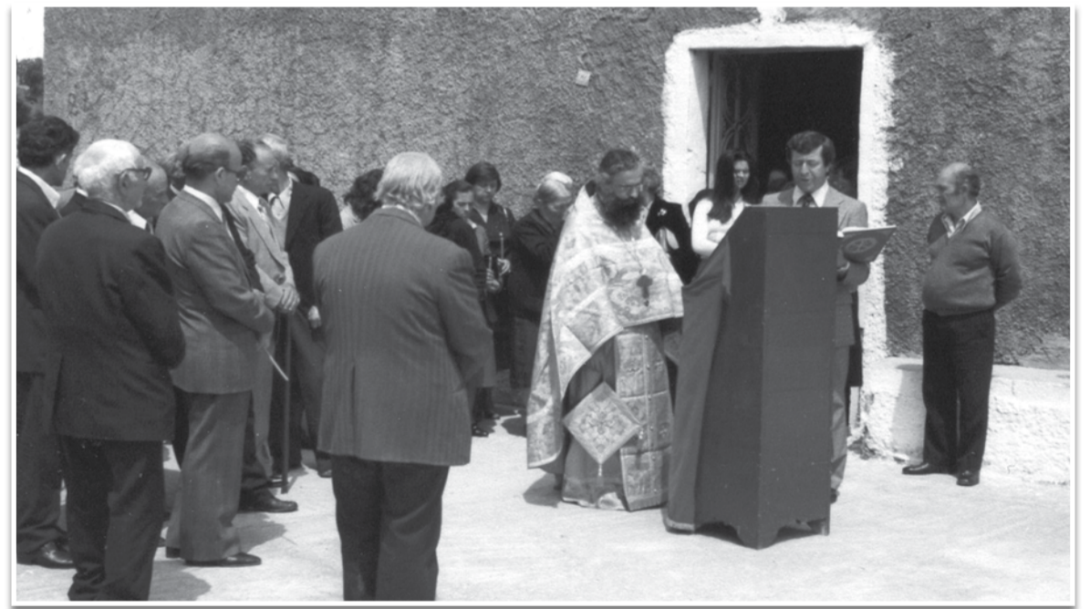
Η Αγάπη στον Αγ. Κωνσταντίνο 1979.

Τα φτωκά πέτρινα χρόνια, ἀρκοῦσαν μόνο τα κόκκινα αυγά ἡ τό πιάτο μαγειρίτσας για τη προσδοκία του Πάσχα. Παιδιά στερημένα, νέοι παιδεμένοι, γονῆδες κουρα-