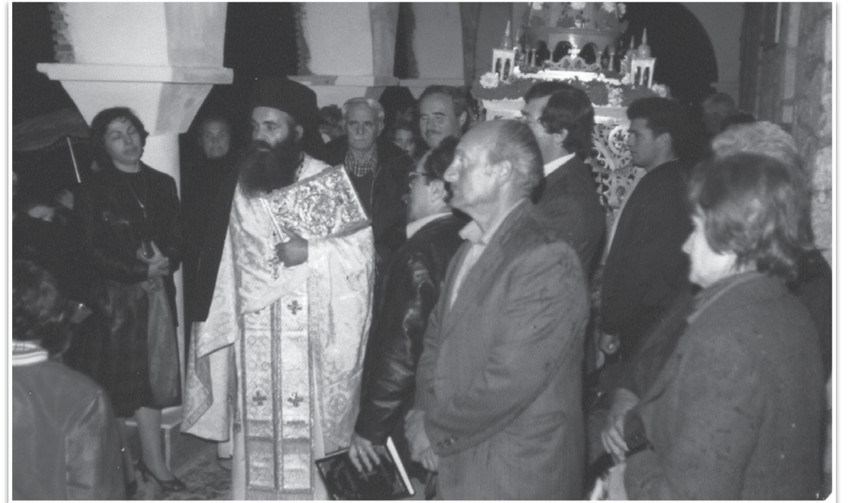
Ο Επιτάφιος το 1982.