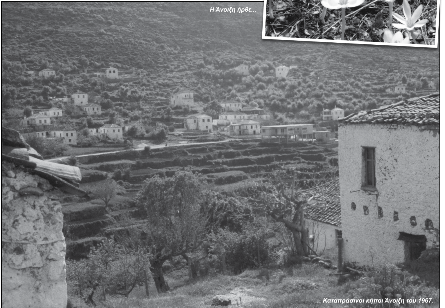
Η Άνοιξη ήρθε...